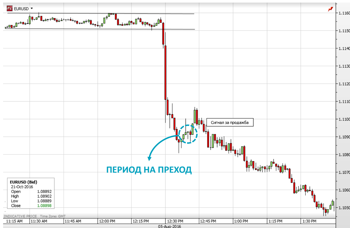
1-минутна графика на EUR/USD